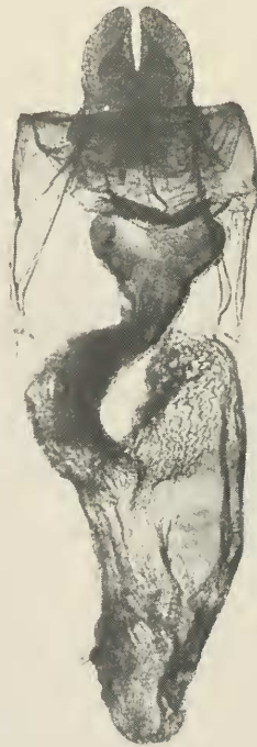
Abb. 2: ♀ Genitalapparat von Oligia dubia Heydem.